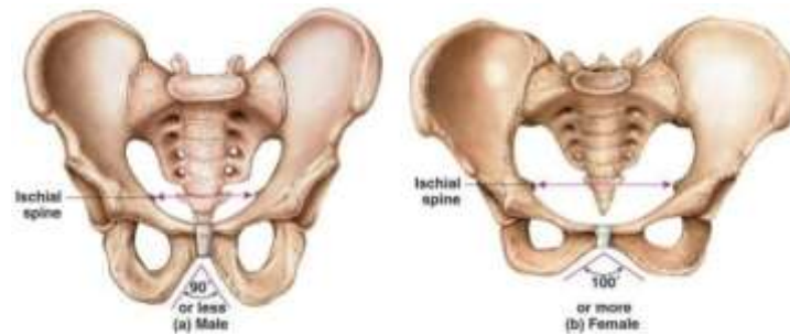
Gambar 1. 1 Karakteristik Panggul

Panggul pria memiliki fungsi dan ukuran yang berbeda dengan wanita. Ukuran panggul wanita lebih lebar dan dangkal dibandingkan dengan panggul pria. Rongga panggul pria lebih sempit dibandingkan dengan wanita. Selain itu, ruas antara tulang duduknya juga tidak selebar wanita. Sementara pada pria, panggul lebih dioptimalkan sebagai alat gerak tubuh saja (Poda GG et al., 2019). Kerangka panggul seorang perempuan lebih ditujukan pada pemenuhan fungsi reproduksi. Bentuk panggul perempuan mempunyai bagian bawah yang lebih luas untuk keperluan kehamilan. Panggul dengan ukuran normal jenis apapun kelahiran pervaginam janin dengan berat badan normal tidak akan mengalami kesukaran.